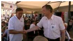
Borut Pahor in Danilo Türk

dogodek pozitivno ali negativno sprejeli, rezultat pa bo izražen v obliki političnega indeksa.